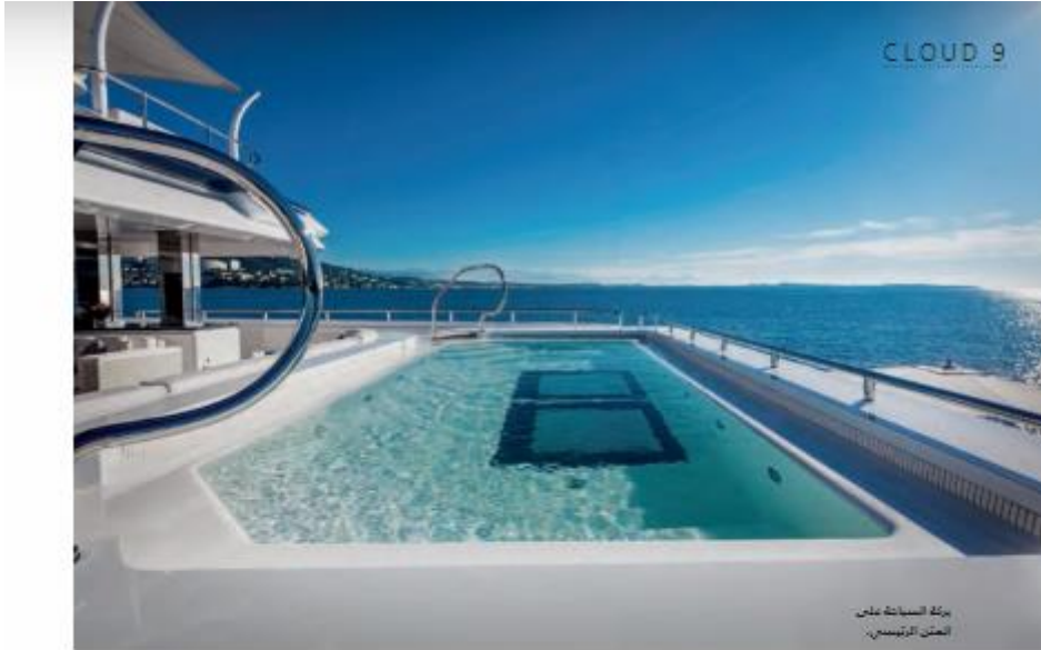
بركة السباحة على المتن الرئيسي.