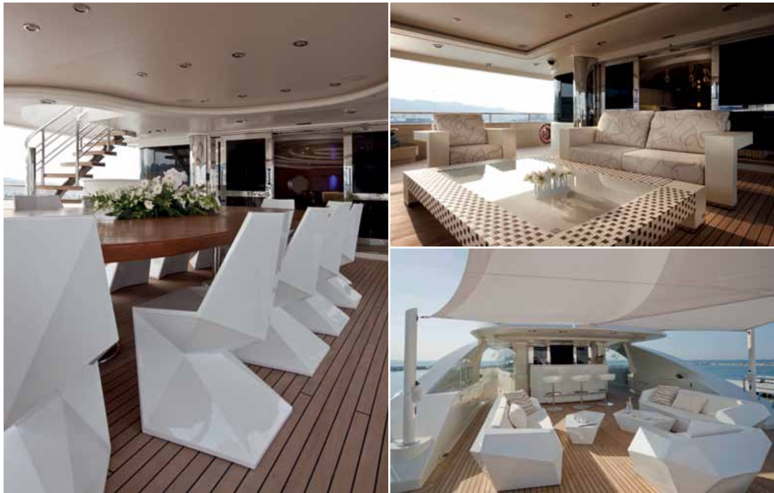
THE COMBINATION OF ONE-OFF CUSTOM AND PRODUCTION PIECES CONTINUES IN THE OUTDOOR AREAS