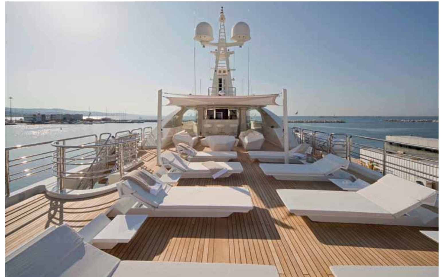
LA LOGICA D'ALTERNANZA TRA PEZZI UNICI E PEZZI DI ARREDAMENTO SEGUE ANCHE NEGLI SPAZI OUTDOOR