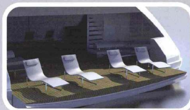
Qui sopra, un interno del Megayacht CRN e a destra la poppa mentre esibisce la spaziosa terrazza. Sotto, l'imbarcazione Aquariva Cento e l'installazione del progetto Megayacht Jankowsky. In alto a tutta pagina, un rendering del progetto CRN Megayacht, dal design unico nel suo genere.