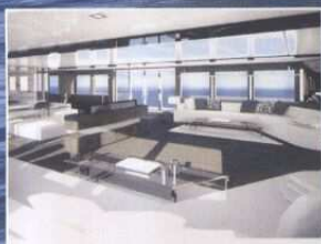
Il "giga-salone" anche se coperto gode di tantissima luce naturale. Caratteristici i grandi divani.