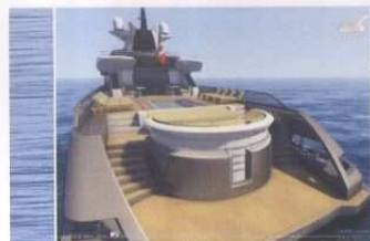
L'ampio pozzetto di poppa sul main deck: zona prendisole, piscina, zona lounge.